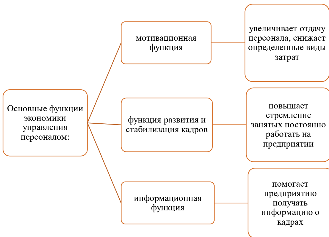
Рисунок 1. Основные функции экономики управления персоналом [авторская разработка].

Объективные сложности сбора и последующей обработки актуальной информации по внедряемым технологиям управления персоналом и проблемы количественной оценки их влияния на конечные результаты производственно-хозяйственной деятельности и морально психологический климат в коллективе во многих случаях не позволяют объективно оценить эффективность управления персоналом не только в рамках внутренней среды отдельных предпринимательских структур, но и на региональном уровне.