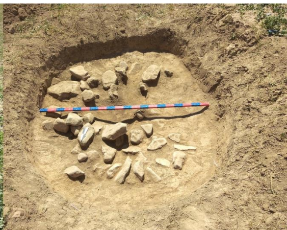
2-rasm. Suyurlitepa qabristonida uchratilgan cho'kmalardan biri va uning tozalangandan keyingi ko'rinishi