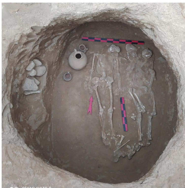
4-rasm. 2-qabr va uning chizmasi.