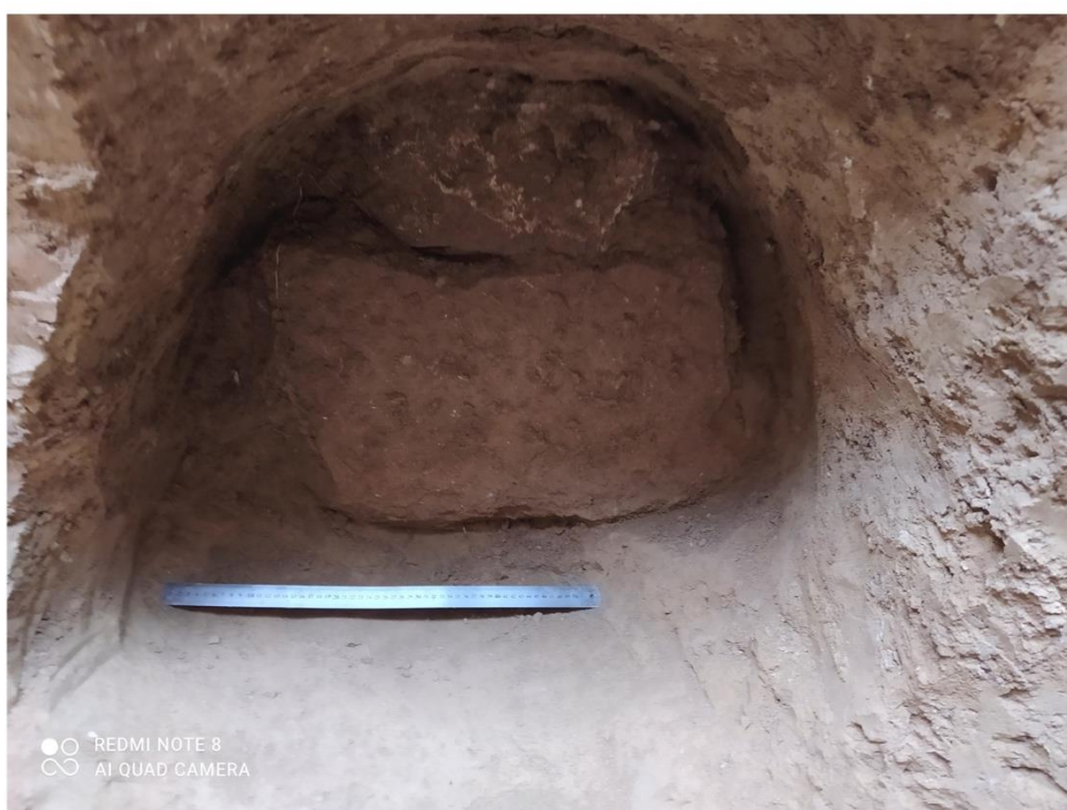
3-rasm. 1-qabrning yuqoridan ko‘rinishi va unga kirish eshigi