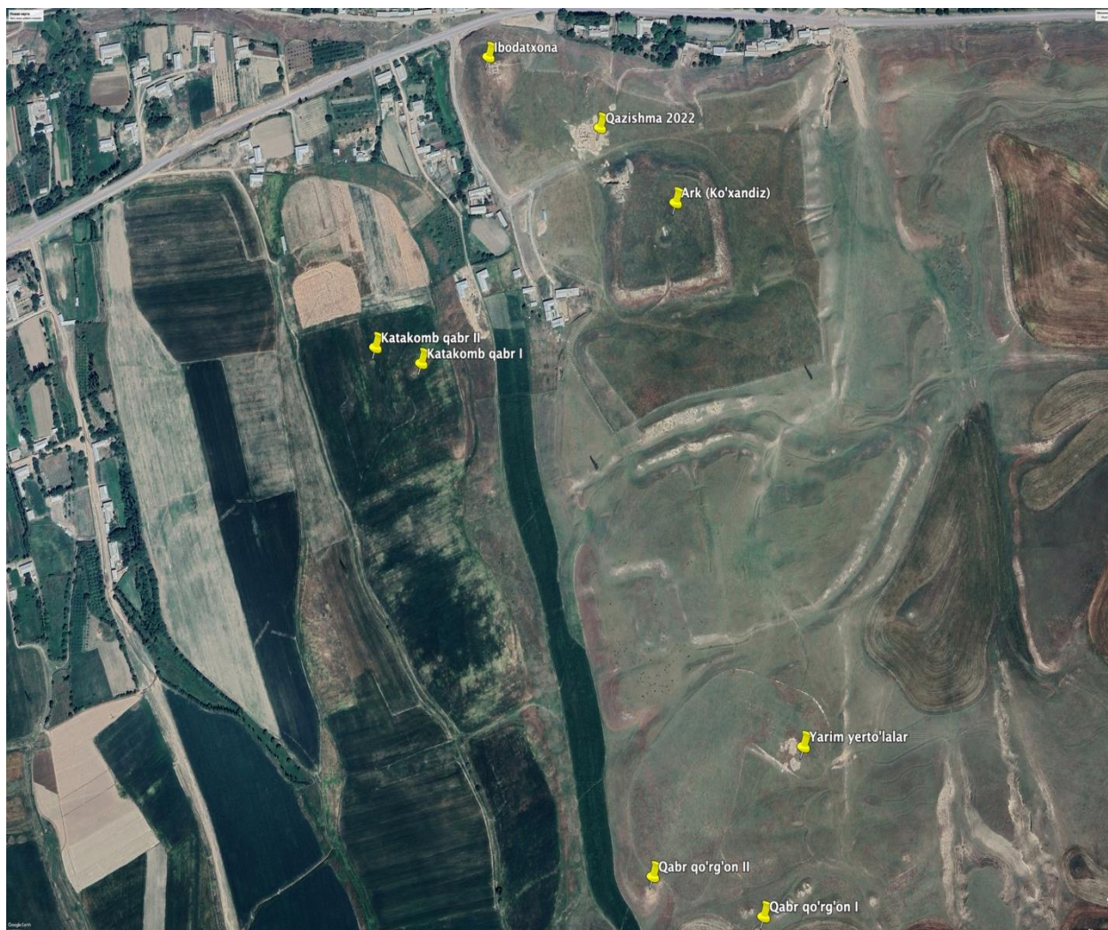
1-rasm. Suyurlitepa yodgorligining «Google earth» dasturida yordamida yuqoridan olingan umumiy ko'rinishi.